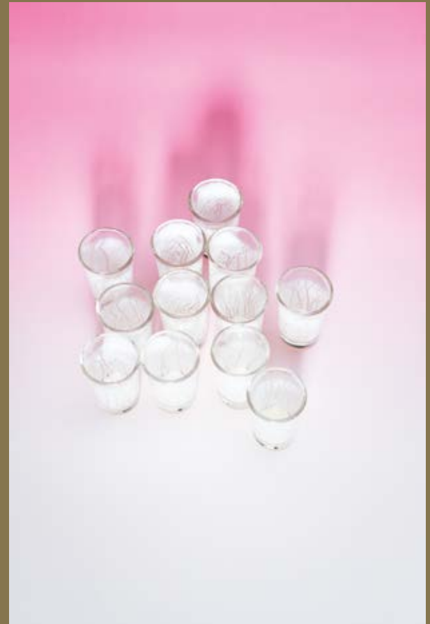
Borjana Ventzislavova, And the sky clears up (potion), 2019